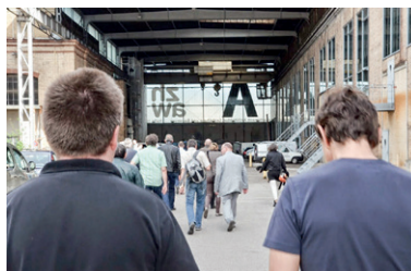
Die Versammlung findet in der ZHAW statt

Wie man erfolgreich an die Öffentlichkeit tritt, um das Produkt Holz zu vermarkten, wissen die Verantwortlichen der Lignum Zürich spätestens seit dem Mai des